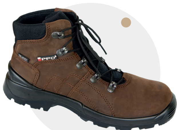
Model 941 MB