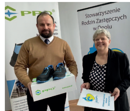
Stowarzyszenie Rodzin Zastępczych JESTEM