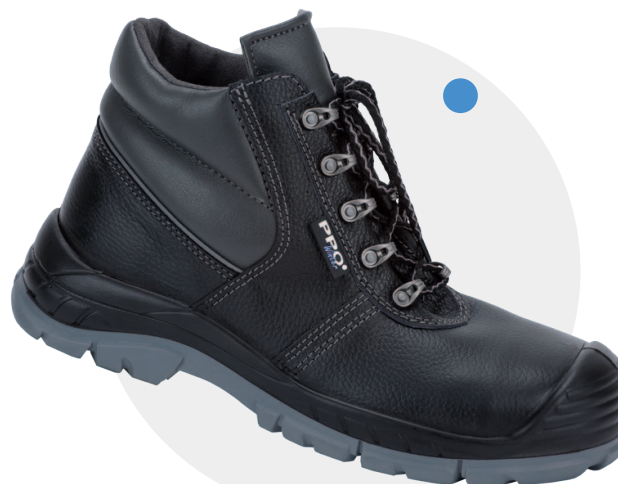
Model 758 (ocieplany) PN-EN ISO 20345, S3, CI, SRC