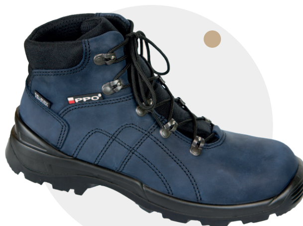
Model 941 MG