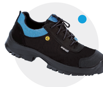
Model Q4 PN-EN ISO 20345, S3, CI, SRC, ESD