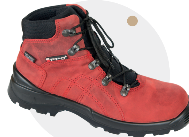
Model 941 MCZ