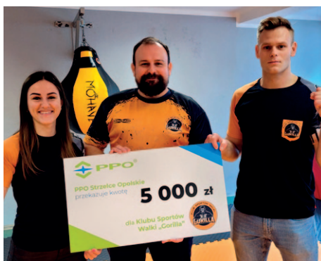
Klub Sportów Walki GORILLA