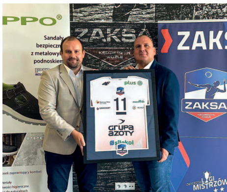
Grupa Azoty ZAKSA Kędzierzyn-Koźle