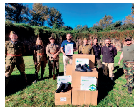
Regionalne Stowarzyszenie Miłośników Historii i Wojskowości im. rtm. W. Pileckiego Kryptonim T-IV