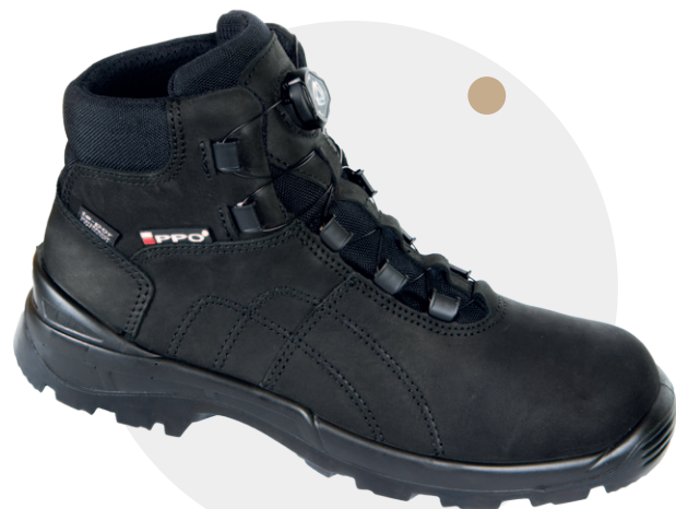
Model 941 MCW