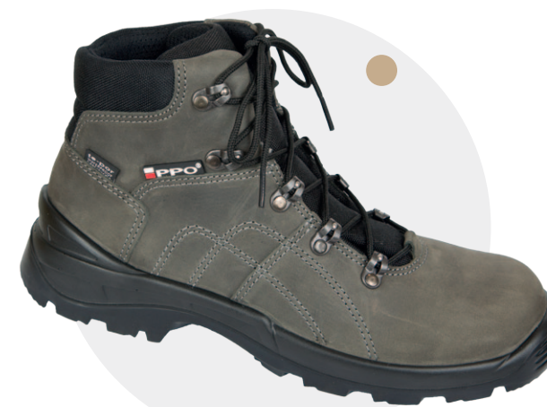
Model 941 MS