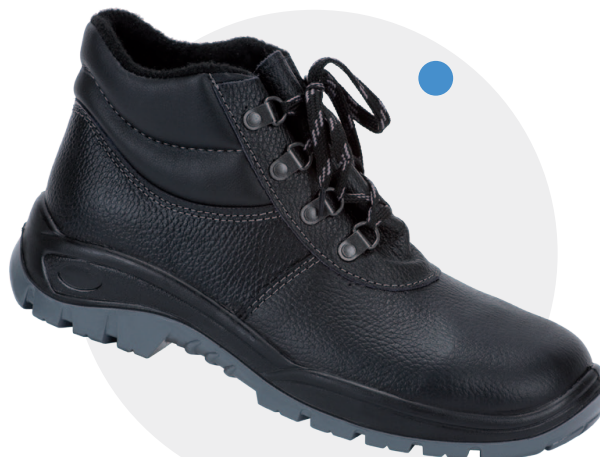
Model 031 (ocieplany) PN-EN ISO 20347, O1, CI, FO, SRC