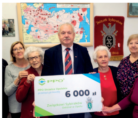
Związek Sybiraków Oddział w Opolu