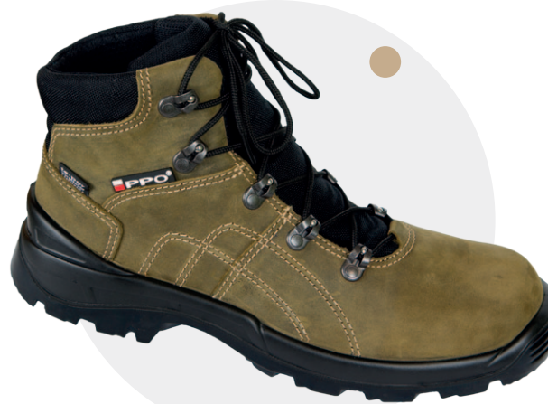
Model 941 MO

Model 941 MC (system szybkiego wiązania)