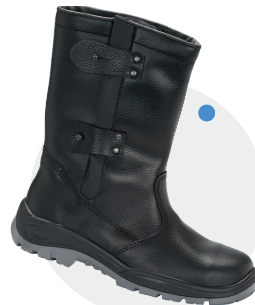
Model 1413 (ocieplany) PN-EN ISO 20345, S1, CI, SRC