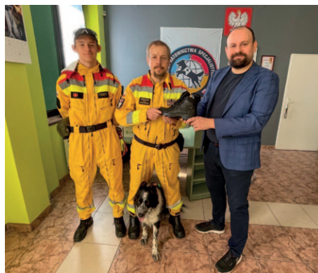
Jednostka Ratownictwa Specjalistycznego OPOLSAR