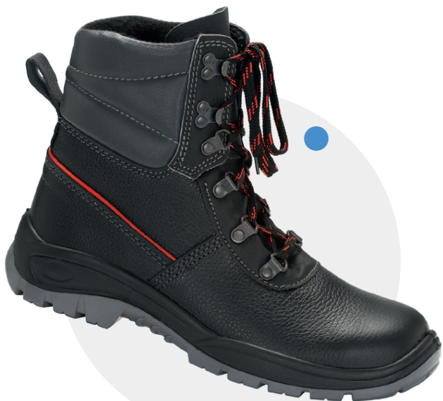
Model 0154 (ocieplany) PN-EN ISO 20345, S3, CI, SRC