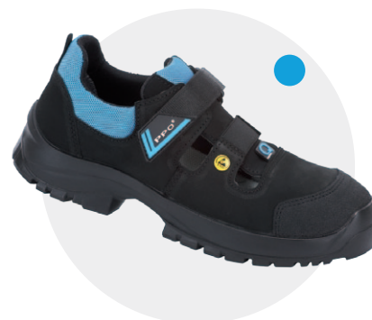
Model Q2 PN-EN ISO 20345, S3, SRC, ESD