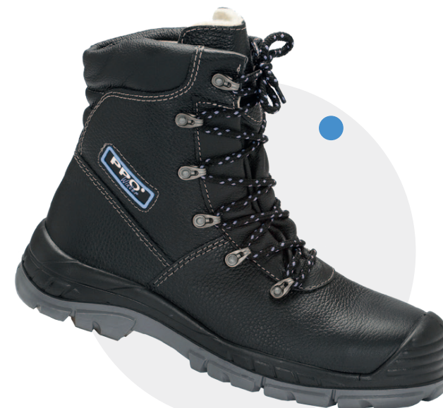
Model 0157 (ocieplany) PN-EN ISO 20345, S3, CI, SRC